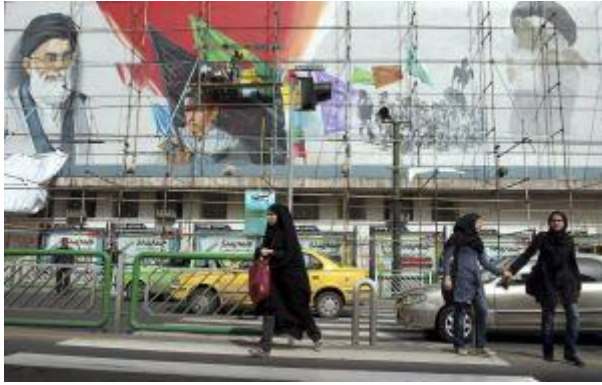
Straatbeeld in Teheran, hoofdstad van Iran.