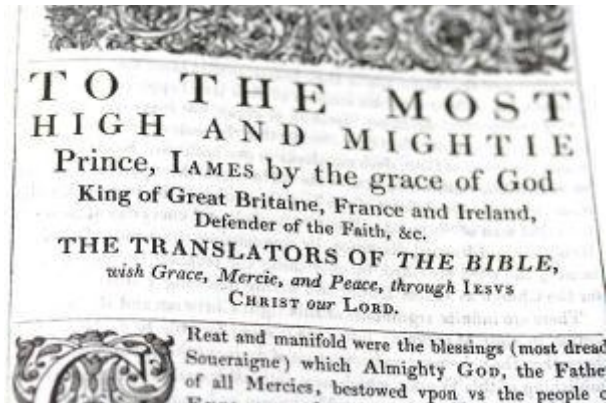
Een King James-bijbel.

Zoals de Statenvertaling de Nederlandse taal sterk beïnvloedde, zo legde de Engelse King James-bijbel de basis voor veel uitdrukkingen in het hedendaagse Engels.